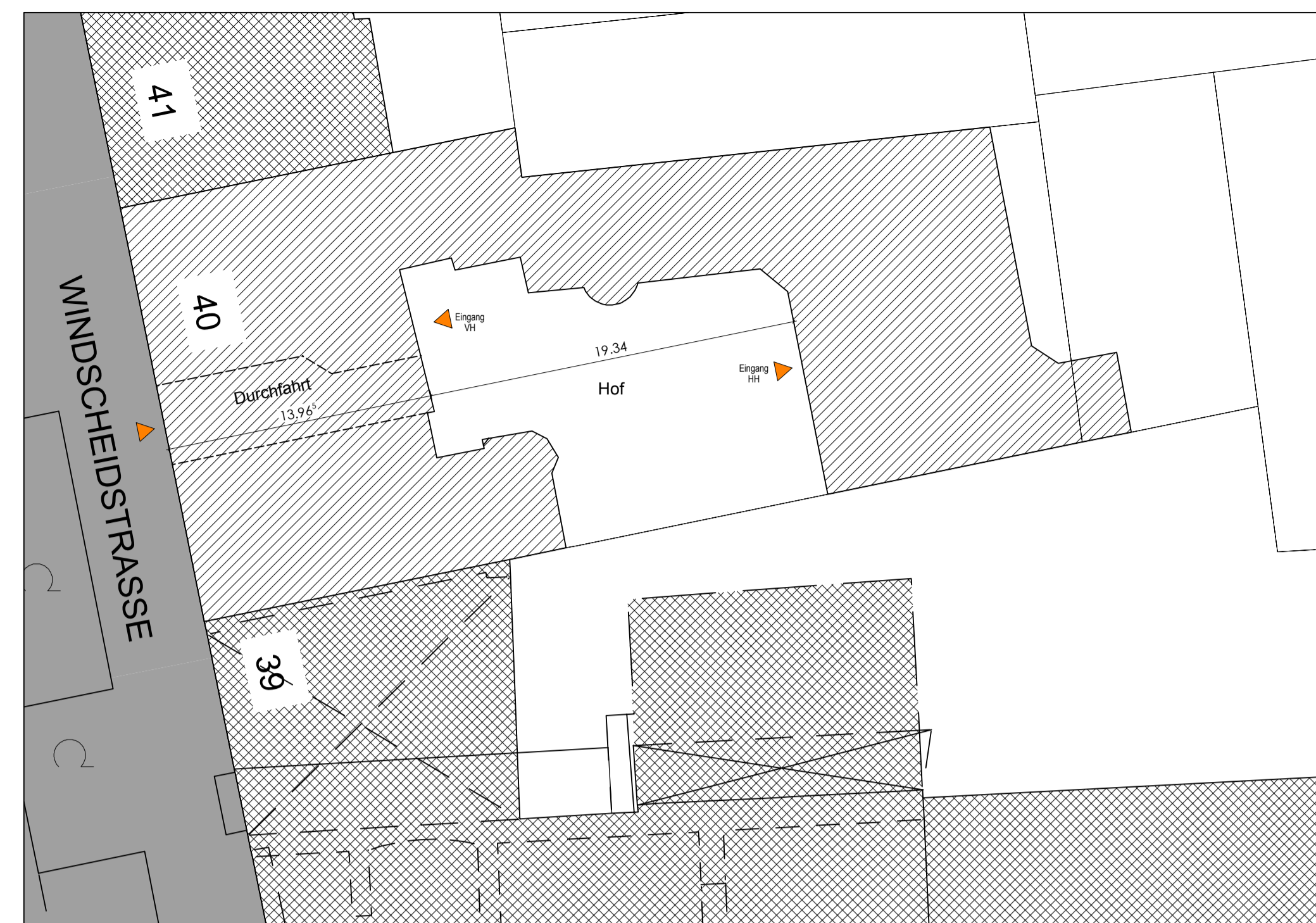
LAGEPLAN M 1:250